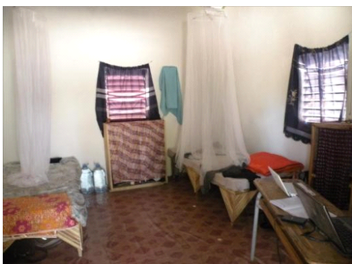
Salle commune des bénévoles