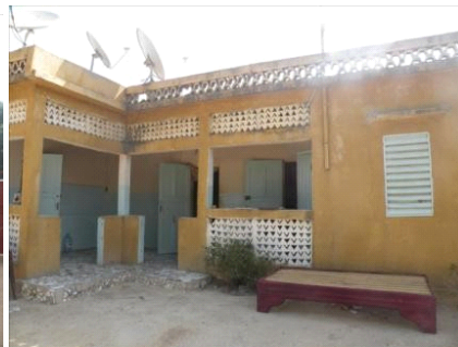
Annexe des bénévoles